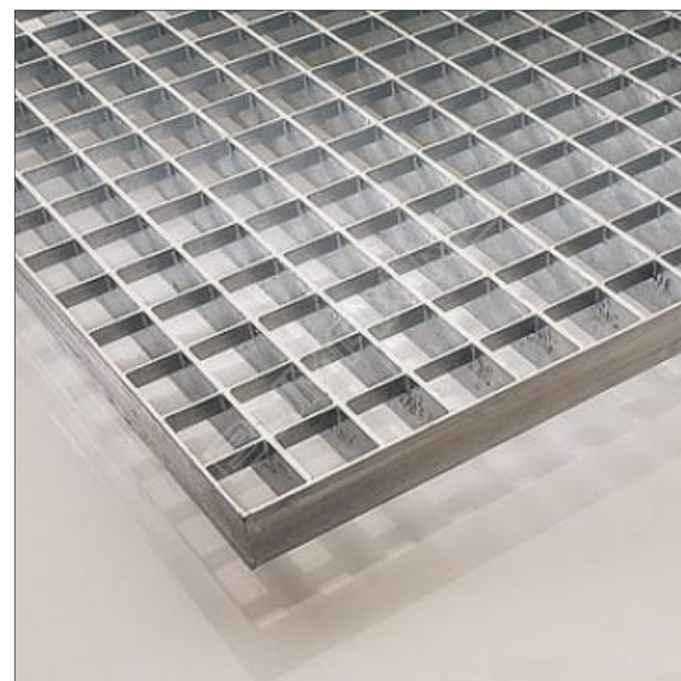
Gemoffelde stalen schrobbroosters 40x40mm